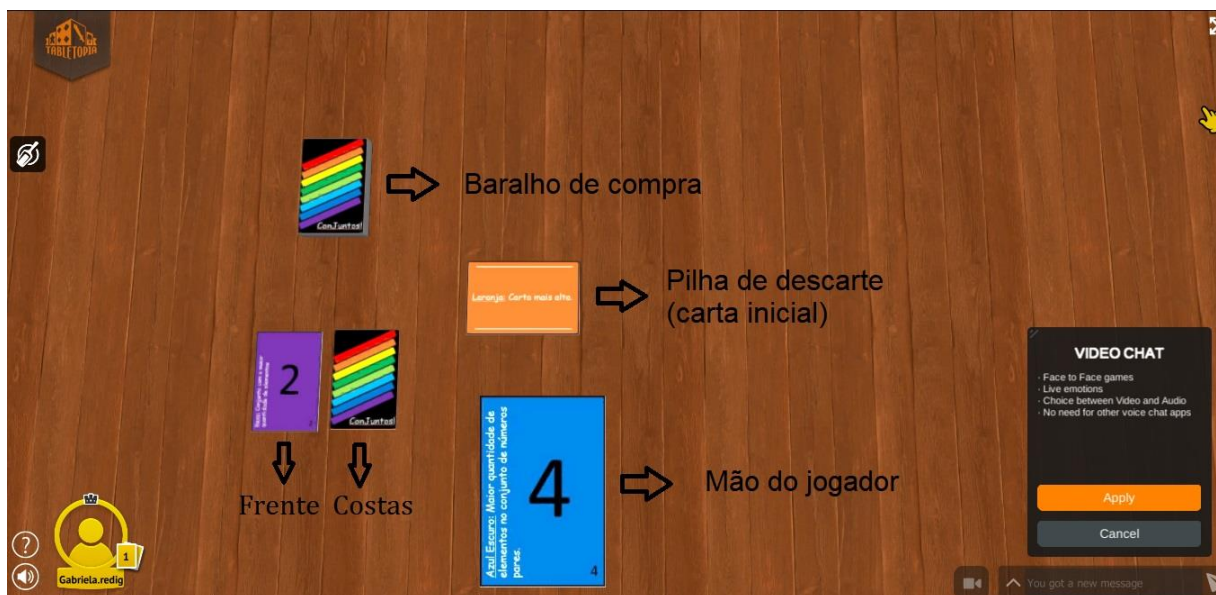
Figura 6 - Como as cartas ficarão depois de inseridas na plataforma tabletopia.