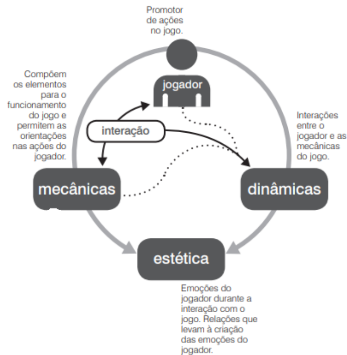
Figura 3 - Relações entre mecânicas, dinâmicas e estética no ato de jogar.