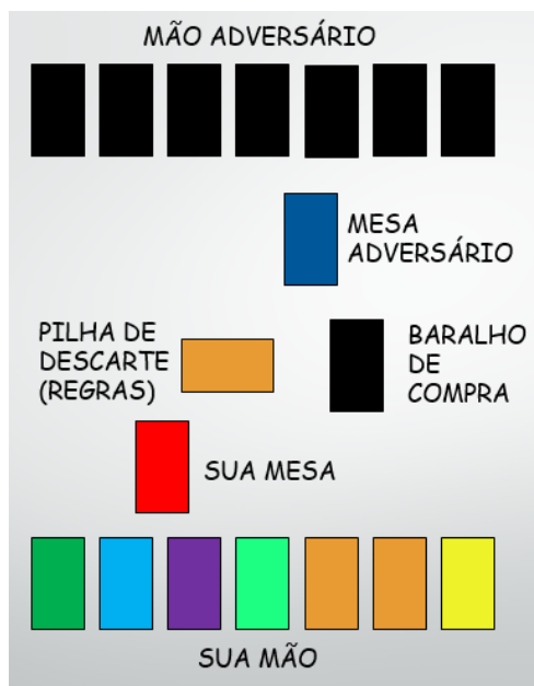
Figura 2 - Montagem do primeiro turno.

necessário. Cada uma das sete cores representa uma forma diferente de ganhar. A figura 11 mostra a montagem do primeiro turno e como as cartas ficarão à disposição dos jogadores.