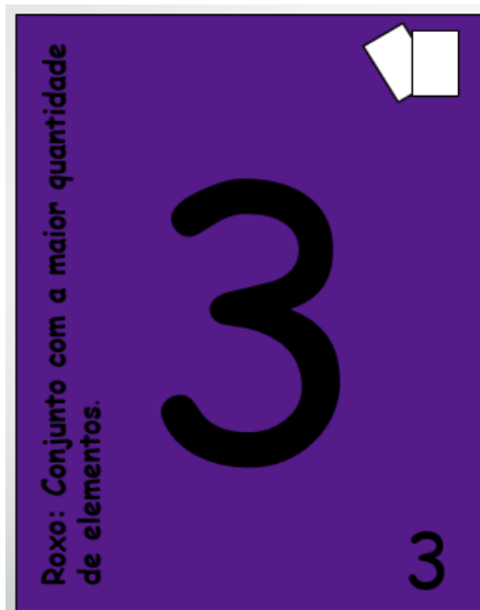
Figura 1 - Carta Ilustrativa.

No canto superior direito há uma figura que representa alguma ação do modo avançado do jogo, como não são todas as cartas que tem ações, algumas dessas cartas não terão essa ilustração.