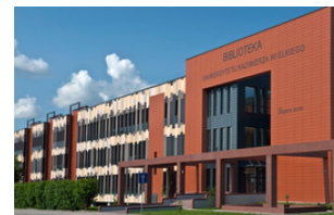
Kazimierz Wielki University