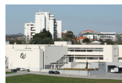
Instituto Politécnico de Viseu