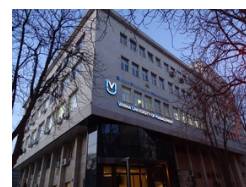
University of Varna