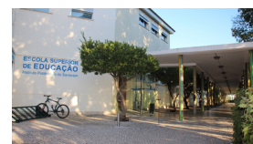
Politécnico de Santarém