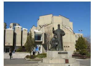
Ss. Cyril and Methodius University in Skopje