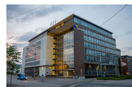
Haaga-Helia University of Applied Sciences