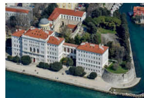
Universidade de Zadar