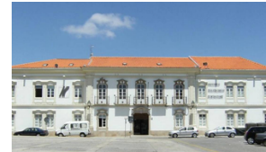
Instituto Politécnico de Portalegre