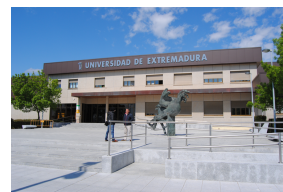
Universidade de Extremadura