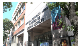
Facultad Latinoamericana de Ciencias Sociales de Buenos Aires