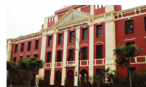
Universidad Nacional Federico Villarreal