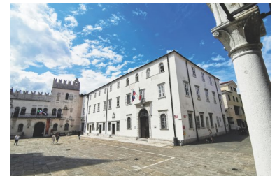
University of Primorska