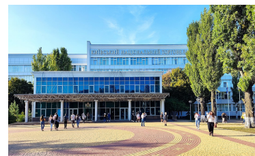
Universidade Nacional de Kiev de Comércio e Economia