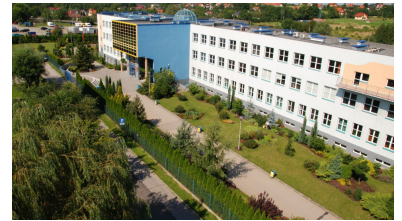
Bielsko-Biała School of Finance and Law