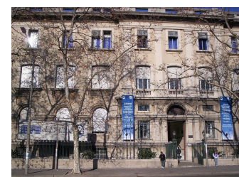
Universidad Católica del Uruguay