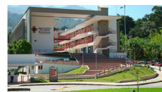
Universidad Pontificia Bolivariana