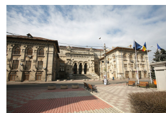
University of Galati