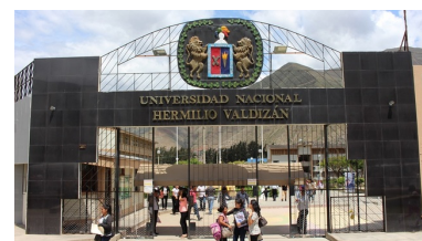
Universidad Nacional Hermilio Valdezán (Huánaco)