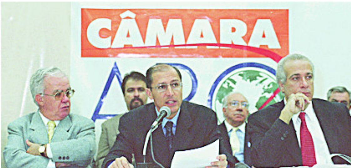
Foto 16: Governador (em exercício) Geraldo Alckmim, ao lado dos então prefeitos Maurício Soares (São Bernardo do Campo) e Celso Daniel (Santo André), em 31 de agosto de 1998.