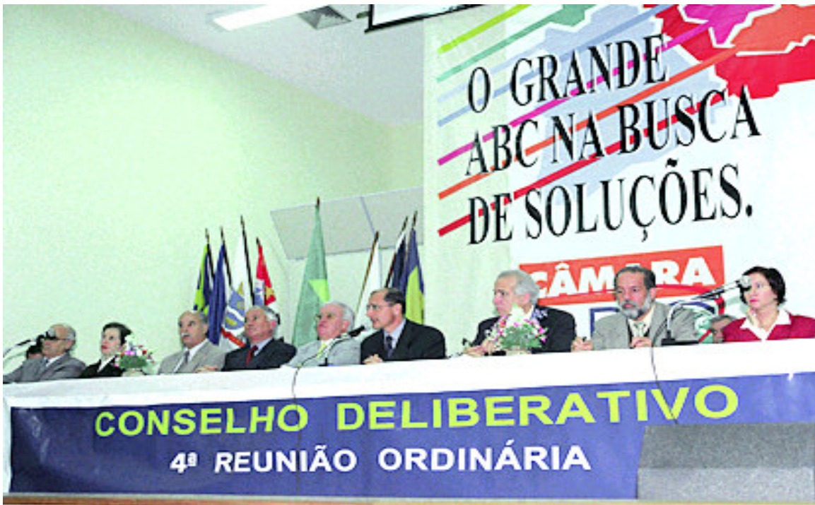
Foto 15: Quarta reunião ordinária do conselho deliberativo da Câmara Regional