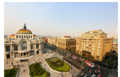
Ciudad de México, Mexico