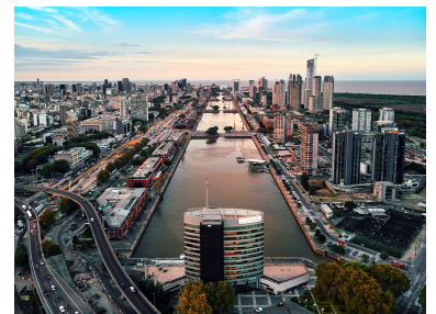
Buenos Aires, Argentina